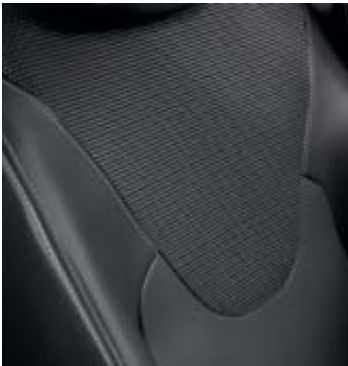
Bekleding stof 'Life' Noir / Gris