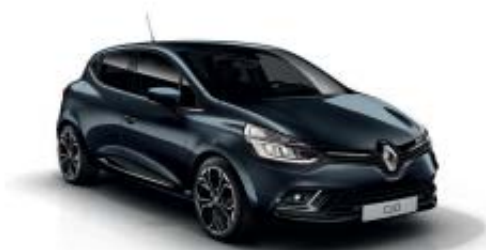
Gris Titanium KPN (MV)*