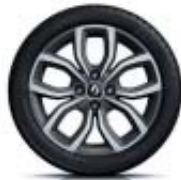
16" Pulsiz Gris