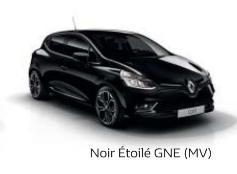
Noir Étoilé GNE (MV)