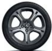
16" GT Line