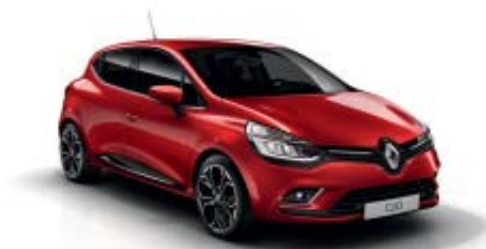
Rouge Flamme NNP (SV)