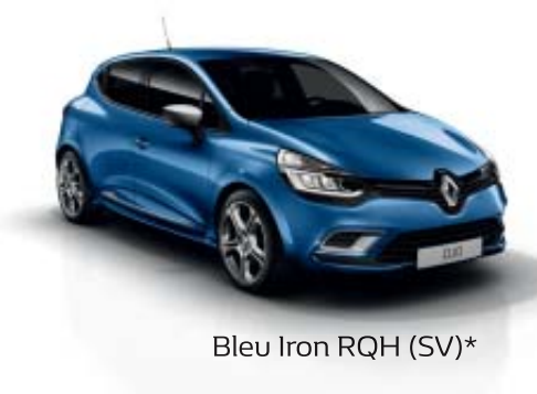
Bleu Iron RQH (SV)*