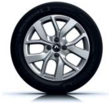
Lichtmetalen wielen 16'' 'Celsium'