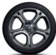
17" GT Line