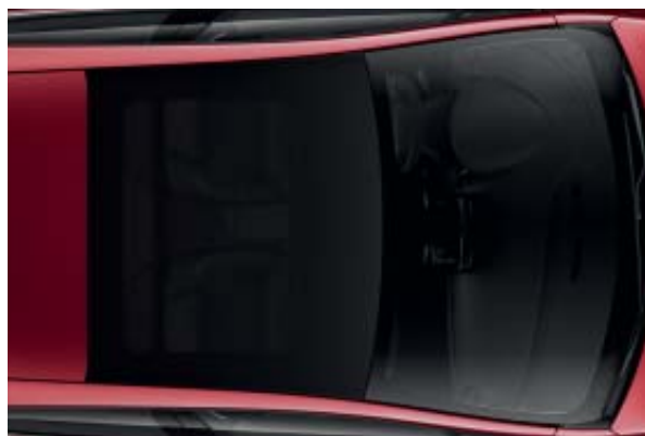
Panoramisch vast glazen dak