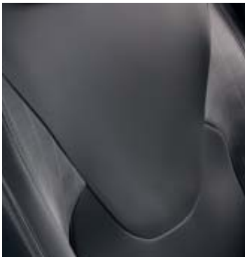
Bekleding stof 'Limited' Noir

Met de Renault Clio Limited profiteert u van een aantal privileges: vollediger uitgerust, gedistingeerd exterieur en zeer scherp geprijsd. Met het nieuwe Limited-label van Renault heeft u keuze uit een breed aanbod aan auto's die aan al uw wensen voldoen. Specifieke ontwerpkenmerken die het model nog eleganter maken, zoals lichtmetalen wielen en privacyglass. Nog intenser rijplezier in de auto dankzij Media Nav multimedia- en navigatiesysteem met DAB+ digitale radio.