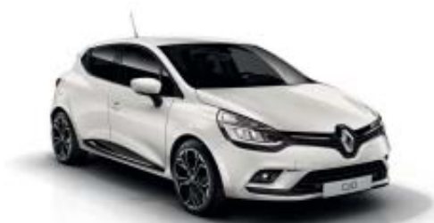
Blanc Nacré QNC (SV)

V : standaardlak met vernislaag MV : metaallak met vernislaag SV : speciale metaallak met vernislaag Kleuren kunnen afwijken van de werkelijkheid * alleen leverbaar i.c.m. Pack GT-Line