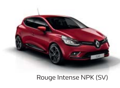
Rouge Intense NPK (SV)