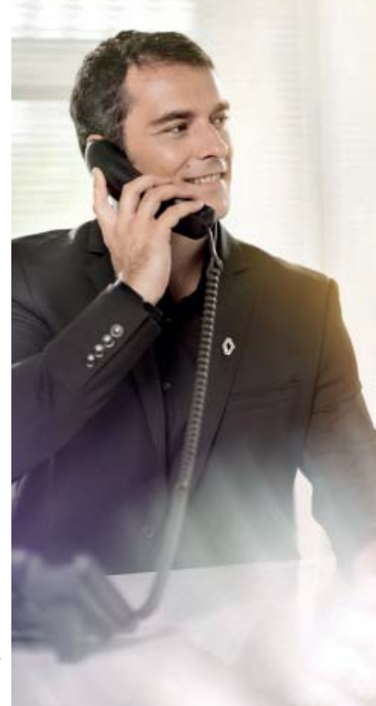
*Bron: SBD study 2014.

Financial Lease is een object gebonden financiering. Dat wil zeggen dat de aangeschafte auto als onderpand dient. Bij Financial Lease staat de auto op uw balans en bent u dus economisch eigenaar van de auto gedurende de looptijd van het lease contract. Deze financieringsvorm kent een vaste looptijd die volledig is af te stemmen op de gebruiksduur van de auto. De auto kan voor het volledige bedrag, exclusief BTW, gefinancierd worden, eventueel met een slottermijn. De maandelijkse leasetermijn bestaat uit rente en aflossing. Door aan het einde van het contract de slottermijn te voldoen, wordt u tevens de juridische eigenaar van de auto. Financial Lease is een on-balance financieringsvorm. Full Operational Lease is de meest complete vorm van leasen. U laat alle financiële, beheersmatige en administratieve taken over aan Renault Business Finance. Verzekering, onderhoud en vervangend vervoer zijn inbegrepen. Bovendien kunt u een contract uitbreiden met het gebruik van een brandstofpas. Full Operational Lease is een "off balance" financieringsnorm waarbij Renault Business Finance al uw zorgen uit handen neemt.