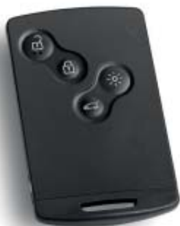
Renault Handsfree Card voor openen, sluiten en starten