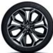
17" Optemic Noir