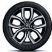
16" Pulsiz Noir