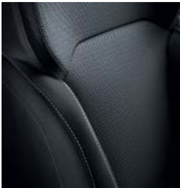
Bekleding stof 'Zen' Noir / Gris

Altijd ontspannen op reis, want de Zen wordt standaard geleverd met een Media Nav multimedia- en navigatiesysteem. Ook door de standaard aanwezigheid van airconditioning, Eco-Mode en het rustieke interieur met Noir- / Gris bekleding en het zwarte softtouch dashboard, zult u nooit een gehaast gevoel krijgen. Het instrumentarium met mat chromen accenten en de hooggls zwarte afwerking van het middenconsole, de ventilatie- en versnellingspookomlijsting ondersteunen dit gevoel van luxe.