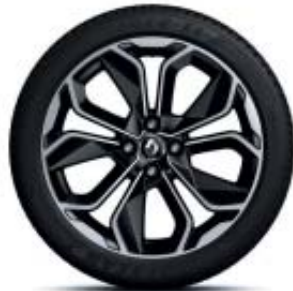
Lichtmetalenwielen 17" 'Optemic Noir'