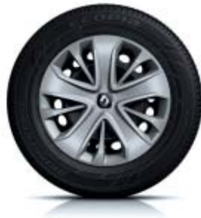
Stalen wielen 15" met wielcap 'Lagoon'