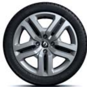
Stalen wielen 16" met wielkop 'Flexwheel'