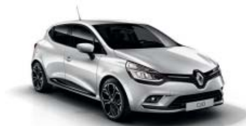
Gris Platine D69 (MV)