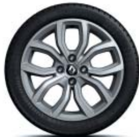
Lichtmetalen 16'' wiel 'Pulse'