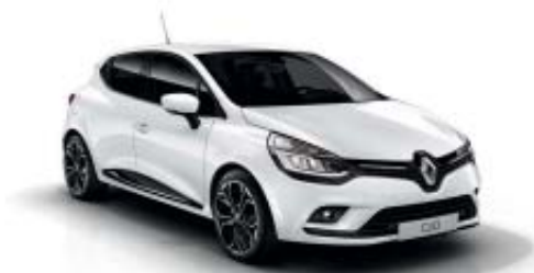
Blanc Glacier 369 (V)