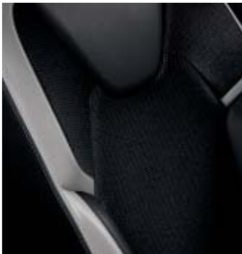
Bekleding stof / TEP 'Bose®' Noir / Gris

De Clio Bose® laat u genieten van alle luxe die de Clio u te bieden heeft. Parkeren wordt u gemakkelijker dan ooit gemaakt, met het standaard Easy Park Assist inparkeersysteem. Met het R-Link multimedia- en navigatiesysteem met Bose® Premium geluidssysteem klinkt uw favoriete muziek nog beter dan voorheen. De verwarmbare voorstoelen, een automatisch dimmende binnenspiegel en een middenarmsteun aan de voorstoel maakt het luxe gevoel in het interieur compleet. Aan het exterieur is de Bose® herkenbaar aan de 17" lichtmetalen wielen in Noir, Privacy Glass en dakstriping Bose®.