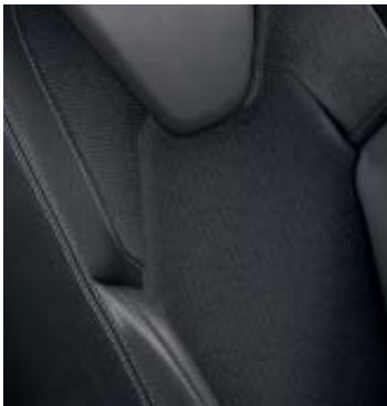
Bekleding stof / TEP 'Luxe' Noir

Ervaar de ongekennde luxe van de Clio Intens. Zo is de auto standaard voorzien van elektronisch geregelde airconditioning, regen- en lichtsensor, Full LED verlichting en de kenmerkende dagrijverlichting in C-Shape vorm. De nieuwe signature van het front geeft de auto een volwassen voorkomen. De nieuwe interieurmaterialen ondersteunen het vernieuwde karakter. De diverse soft-touch dashboards, de nieuwe bekledingsmaterialen en gekleurde accenten zijn de juiste elementen om u een nog rijkere ervaring te geven in nieuwe Clio Intens.